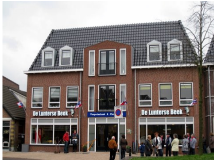
heropening 'De Lunterse Beek' aan de Molenparkweg 6

30 maart 2011: Dorpsraad was vertegenwoordigd bij de heropening van Visspecialzaak & Visrestaurant De Lunterse Beek (Kees en Greet Dijkhuizen)