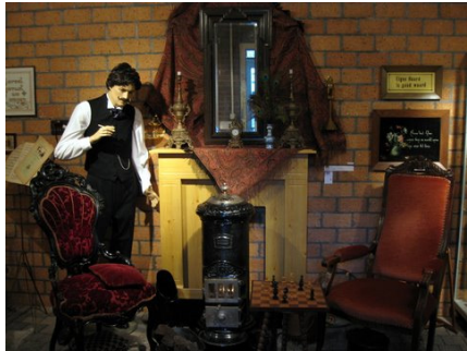
'Mijmeren rond de haard'