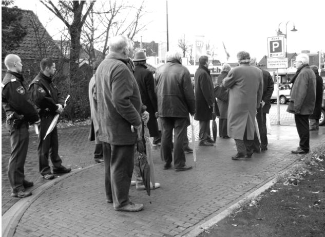
Uitbreiding Wilbrinkplein achter AH