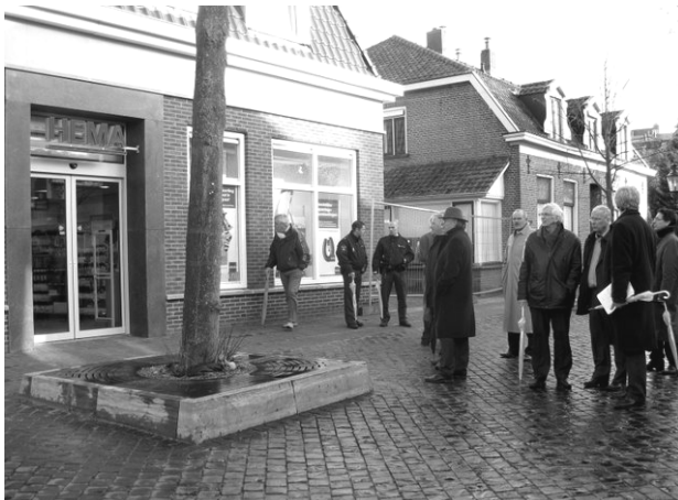
HEMA vestiging in de Dorpsstraat

Op de plaats van de voormalige Eendenvijver staat nu het appartementengebouw 'De Vijverhof' met HEMA-vestiging. Men is niet erg blij met de grote plakaten die deze gesloten vensters sieren.