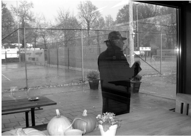
Sportcomplex De Wormshoef